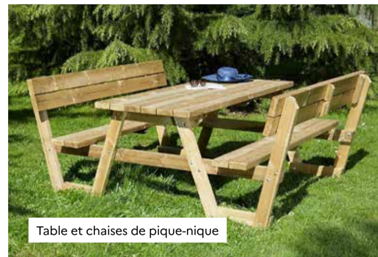
Table et chaises de pique-nique