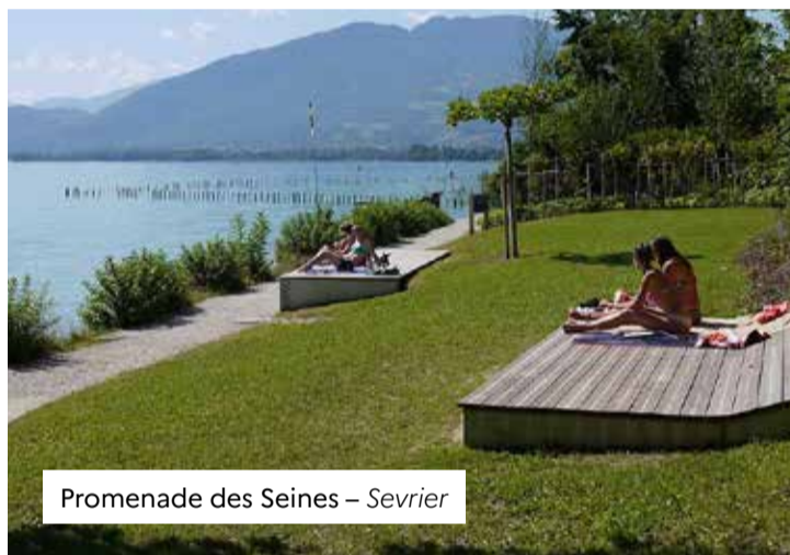
Promenade des Seines – Sevrier