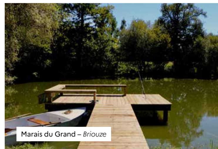
Marais du Grand – Briouze

NOTRE OBJECTIF : Voir les Spinoliens s'approprier ces berges et partager des moments de convivialité, de découverte, de bien-être, et de loisirs.