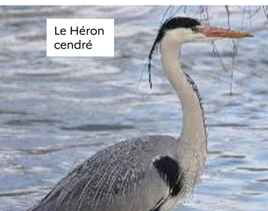
Le Héron cendré

Ces milieux abritent une grande diversité d'espèces animales et végétales, dont certaines sont rares, protégées, ou même déterminantes d'un milieu.