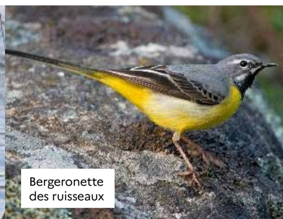
Bergeronnette des ruisseaux