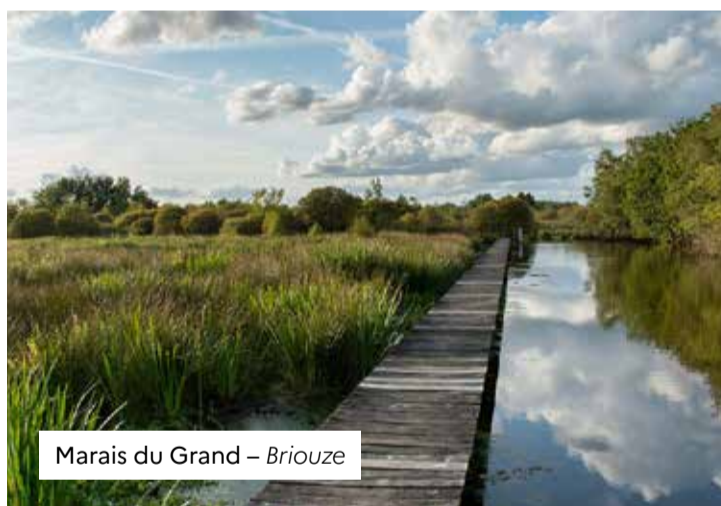
Marais du Grand – Briouze