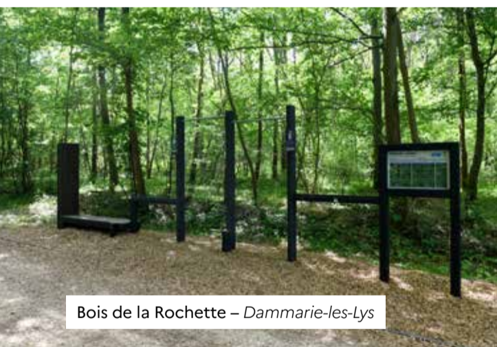
Bois de la Rochette – Dammarie-les-Lys