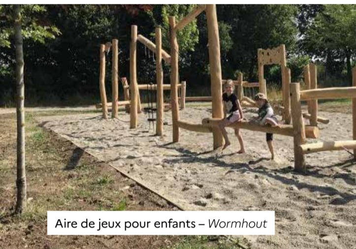
Aire de jeux pour enfants – Wormhout