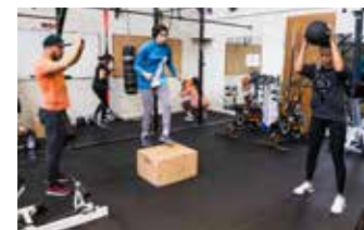
Salle de musculation Avenue du 8 mai 1945