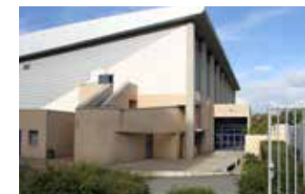
Complexe sportif Rue de l'Île-de-France