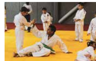
Dojo du Cosec (judo)