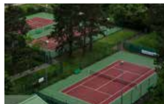
Tennis Rue Bellevue