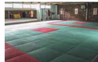
Dojo Daudet (École Kim Diéu) Rue Rossini

La vie locale est rythmée par des événements associatifs et municipaux. Les acteurs de la vie associative proposent des activités sportives, culturelles, de loisirs et solidaire tout au long de l'année.