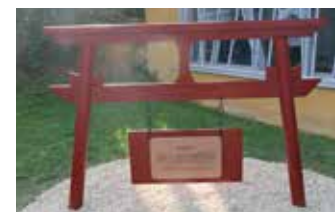
Dojo de karaté salle polyvalente Rue de Quincy