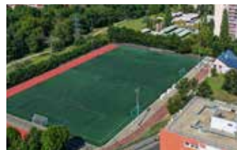
Stade Mimoun Avenue du 8 mai 1945