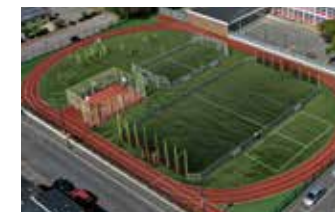
City-Stade Rue du Petit Pont