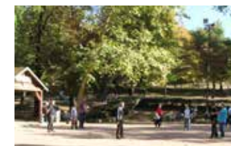
Terrain de pétanque Parc de la Mairie