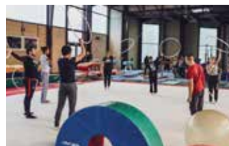
COSEC Rue du Boisselet

Tout au long de l'année, les nombreux équipements sportifs municipaux accueillent les associations sportives pour des pratiques qui vont du loisir jusqu'au haut-niveau. De plus, notre ville accueille régulièrement des compétitions de niveau régional voire même parfois national.