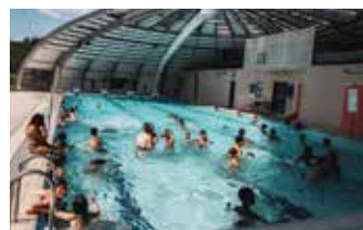
Piscine Pierre Bonningue Rue Jean-Paul Sartre