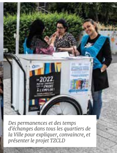
Des permanences et des temps d'échanges dans tous les quartiers de la Ville pour expliquer, convaincre, et présenter le projet TZCLD