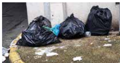
Les dépôts sauvages de déchets enlaidissent nos rues et ont des conséquences sanitaires néfastes à court et long terme (rongeurs, maladies, pollutions...).

Les auteurs de ces dépôts sauvages sont passibles d'une amende de 450€