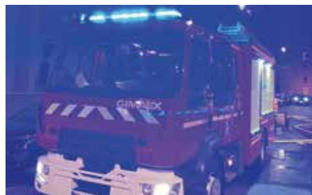
La nuit du 4 au 5 avril dernier, un véhicule bloquait un camion de pompiers en intervention à Epinay-sous-Sénart.

Si le stationnement est jugé abusif, il peut donner lieu à une amende de 135 euros et la mise en fourrière du véhicule.