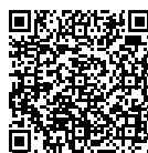
↑ M. le Maire sur CNEWS