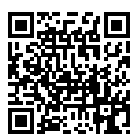
↑ M. le Maire sur RMC