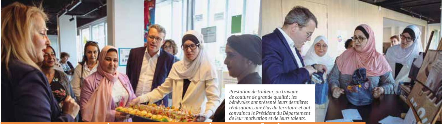
Prestation de traiteur, ou travaux de couture de grande qualité : les bénévoles ont présenté leurs dernières réalisations aux élus du territoire et ont convaincu le Président du Département de leur motivation et de leurs talents.