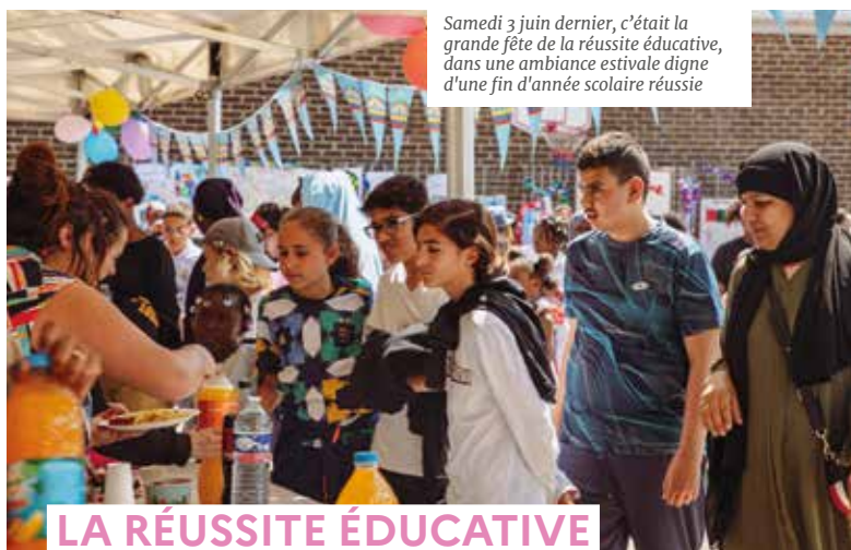
Samedi 3 juin dernier, c'était la grande fête de la réussite éducative, dans une ambiance estivale digne d'une fin d'année scolaire réussie