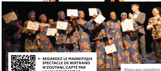
Bravo aux cuisinières !