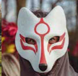
Les Spinoliens ont rivalisé d'imagination pour leurs déguisements ! Merci à tous !