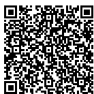
↑ M. le Maire sur BFMTV

M. le Maire reste engagé et mobilisé pour faire évoluer la loi et la capacité d'intervention des forces de l'ordre afin de trouver une solution à ce phénomène et pouvoir garantir la sécurité des habitants des quartiers où ce type de comportement est récurrent.