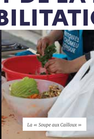
La « Soupe aux Cailloux »