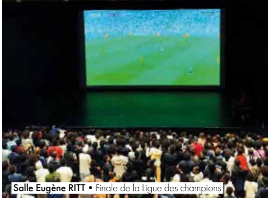
Salle Eugène RITT • Finale de la Ligue des champions