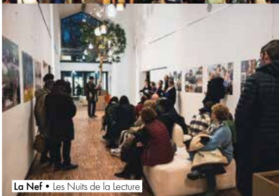
La Nef • Les Nuits de la Lecture

La saison culturelle s'exprime également dans les rues et places de la ville ainsi que dans l'enceinte d'autres équipements municipaux, lors des grands rendez-vous saisonniers, à l'occasion de projets transversaux portés par la Municipalité ou encore à travers différents projets associatifs.