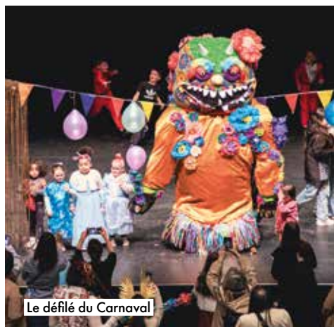
Le défilé du Carnaval

La saison culturelle s'exprime également dans les rues et places de la ville ainsi que dans l'enceinte d'autres équipements municipaux, lors des grands rendez-vous saisonniers, à l'occasion de projets transversaux portés par la Municipalité ou encore à travers différents projets associatifs.