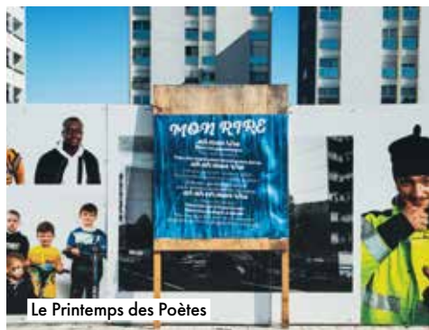
Le Printemps des Poètes