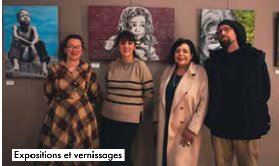
Expositions et vernissages