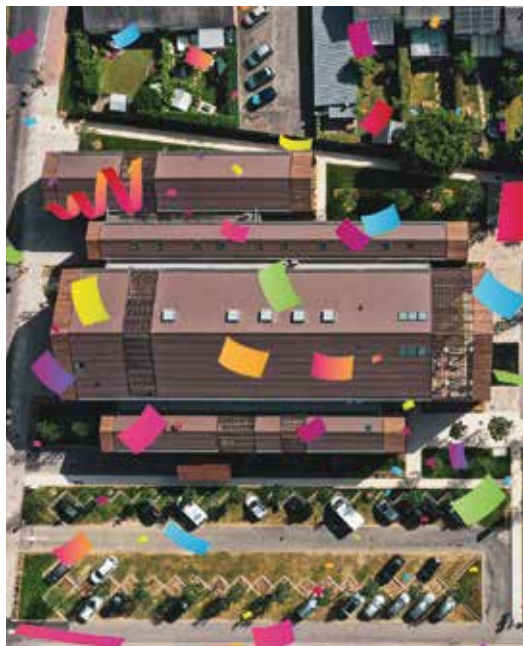
Table-ronde, Ciné-débat, ateliers, spectacle autour du handicap cognitif seront au cœur de nos propositions. Venez rencontrer nos partenaires et assister au spectacle de clôture de cette semaine dédiée au Handicap : «ZOUROU, au delà des mots» (voir page 22)

UNE SEMAINE AVEC LES ASSOCIATIONS ET COLLECTIFS LES PLUS ACTIFS DU TERRITOIRE POUR SE RENCONTRER ET ÉCHANGER.