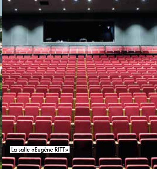
La salle «Eugène RITT»