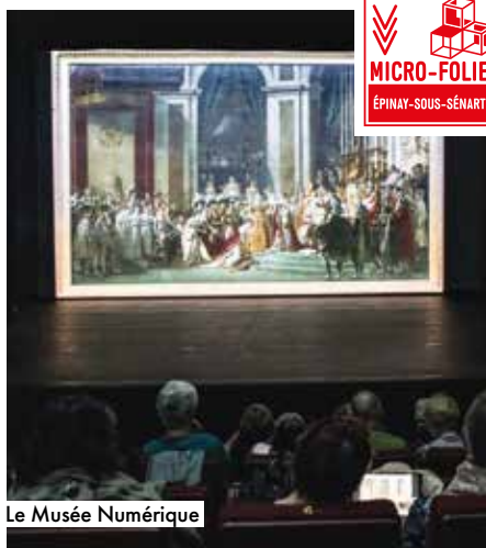
Le Musée Numérique