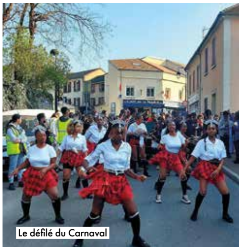
Le défilé du Carnaval

La saison culturelle s'exprime également dans les rues et places de la ville ainsi que dans l'enceinte d'autres équipements municipaux, lors des grands rendez-vous saisonniers, à l'occasion de projets transversaux portés par la Municipalité ou encore à travers différents projets associatifs.