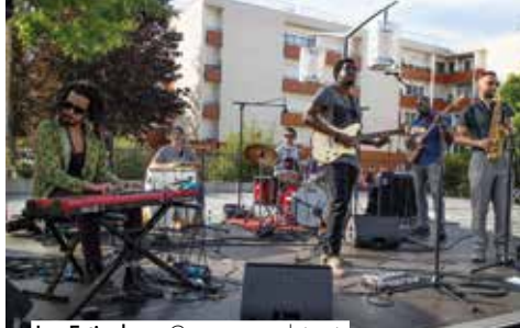
Les Estivales • Concerts en plein air