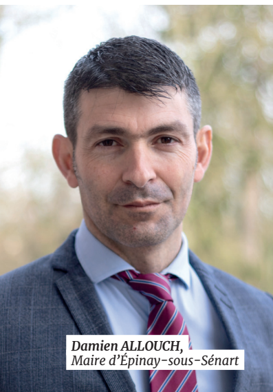
Damien ALLOUCH, Maire d'Épinay-sous-Sénart