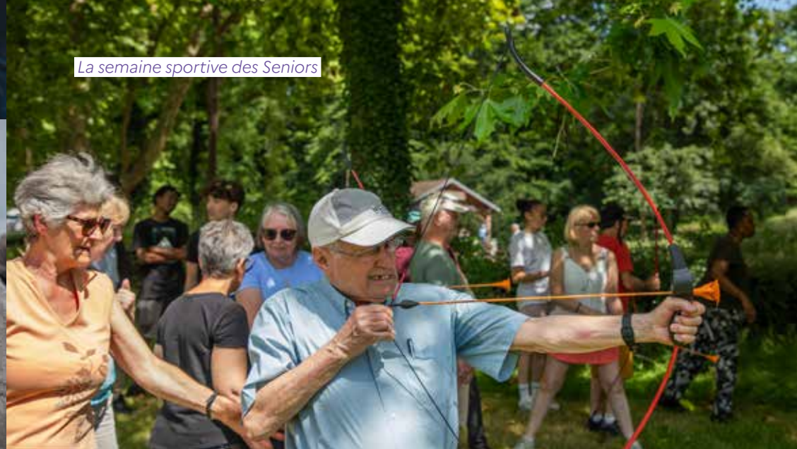
La semaine sportive des Seniors