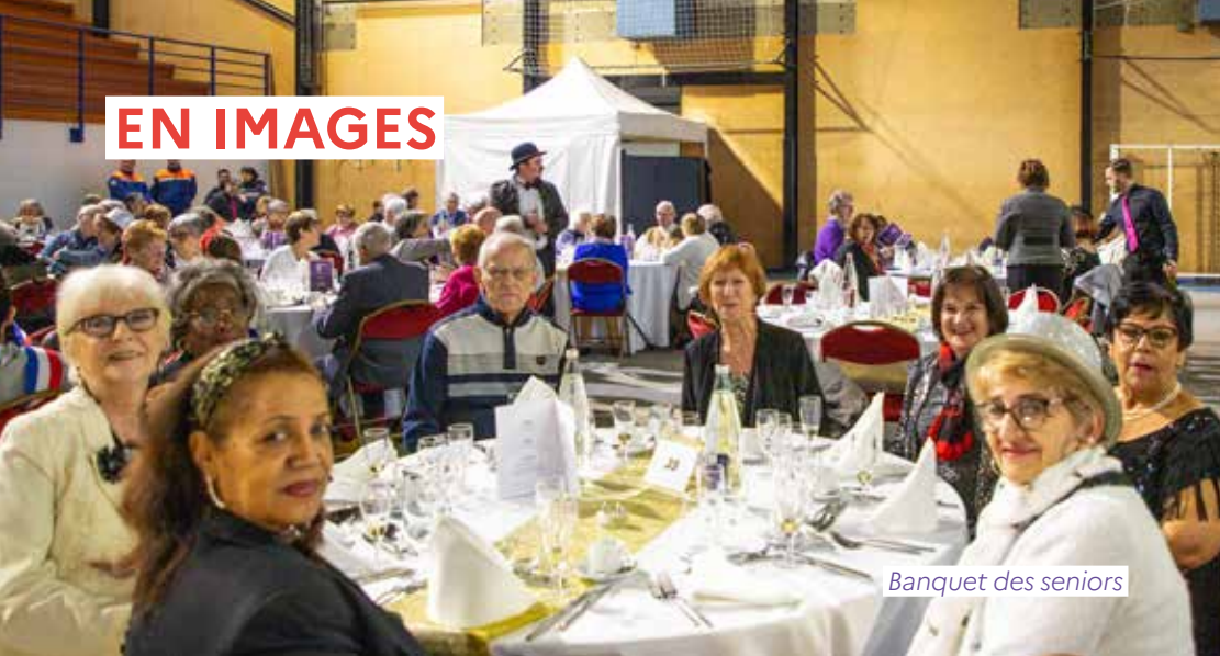
Banquet des seniors