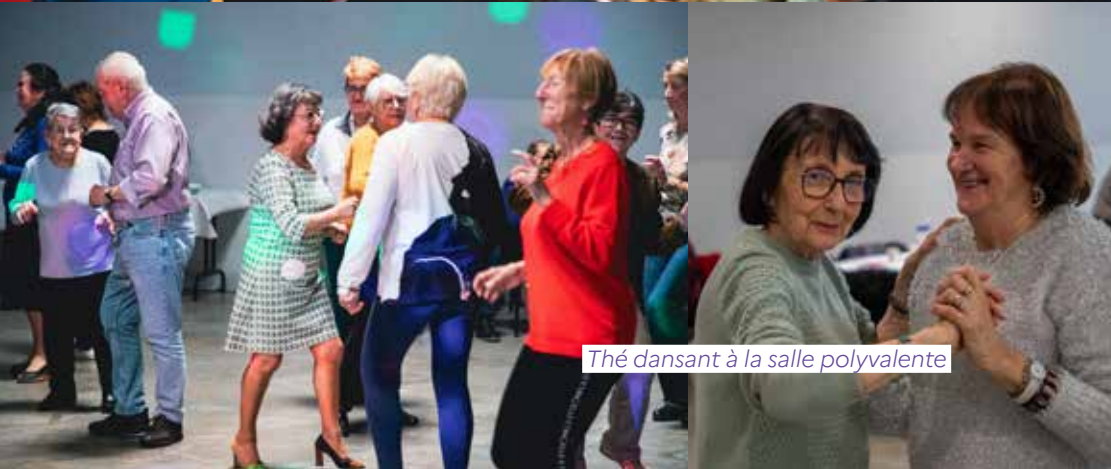
Thé dansant à la salle polyvalente