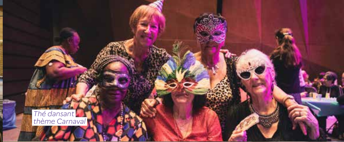
Thé dansant thème Carnaval