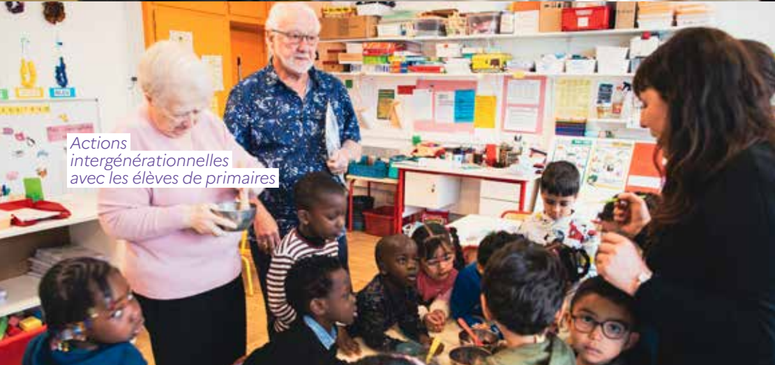
Actions intergénérationnelles avec les élèves de primaires